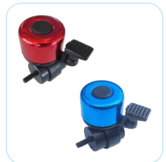
Bel rood & blauw