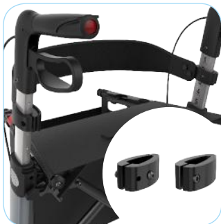
Klemmen voor hoogteverstelling van de ruggordel