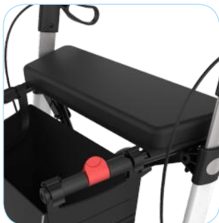
Vaste zitting met kussen