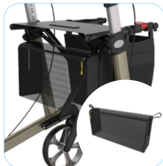
Nettas onder de zitting