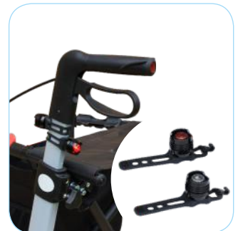
LED-lamp rood & wit