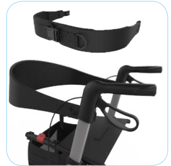
Ruggordel (& lengteverstelbare versie)